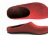
Color No. 4823 rubin Sizes 36-46