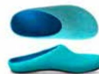
Color No. 4833 aqua Sizes 36-42