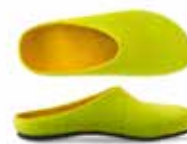
Color No. 4832 lemon Sizes 36-42

Die extradicke Filzsohle ist in Naturlatex getränkt und anatomisch geformt. Dadurch sitzt der Schuh wie eine zweite Haut. Der Schuh ist stossgedämpft und rutschfest.