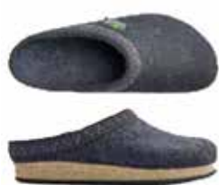
Color No. 8801 graphit Sizes 36-54

Preise in CHF inkl. MwSt. Ab Werk. Änderungen und Irrtümer vorbehalten.