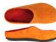
Color No. 4807 orange Sizes 36-42