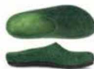
Color No. 4818 dark green Sizes 36-46