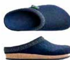
Color No. 8803 navy Sizes 36-46