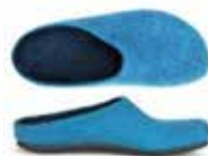
Color No. 4802 petrol Sizes 36-42