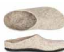
model AT-719 Filzsohle / felt sole Color No. 4853 Sizes 36-46