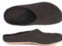
model AR-713 Ledersohle / leather sole Color No. 4851 Sizes 36-46

Das Juraschaf hat seinen Ursprung im Frutigschaf und ist in der französischen Schweiz beheimatet. Die Wolle dieses Bergschafes besitzt eine besonders feine, nahezu merinoähnliche Qualität.