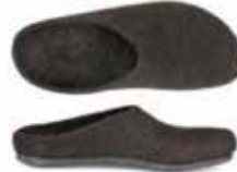
model AT-719 Filzsohle / felt sole Color No. 4851 Sizes 36-46