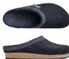
Color No. 8802 black Sizes 36-46