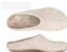
model AR-713 Ledersohle / leather sole Color No. 4853 Sizes 36-46

Das Coburger Fuchsschaf - eine widerstandsfähige Landschaftsrasse. Die Besonderheit der Wolle ist die rotbraune Farbe. Bei der Geburt ist sie goldgelb bis rotbraun ("Goldenes Vlies"), hellt im Laufe der Zeit auf - bewahrt aber ihren rötlichbraunen Schimmer. Aktuell gibt es nur mehr einige tausend Schafe.